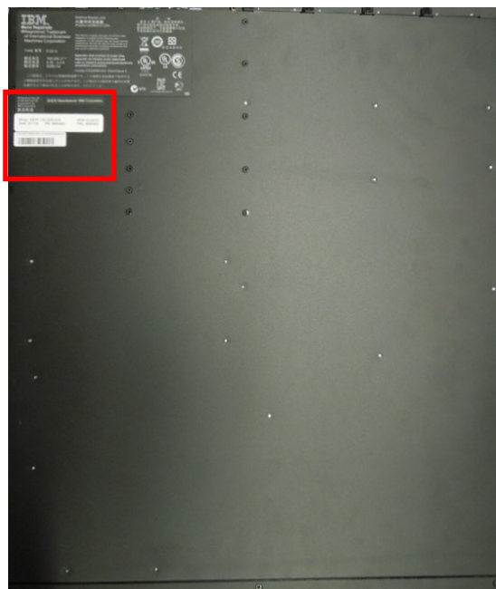
図 1. シリアル番号記載位置 (ユニット裏面)